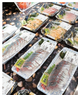
上/屋外にはカニの生け簀が設置される。下/鮮度抜群の魚や刺身、寿司などを手頃な価格で販売する。毎週日曜11時からのマグロの解体ショーは迫力満点。