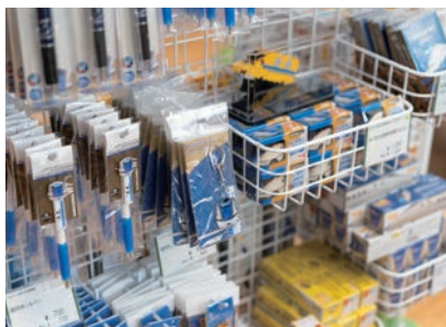
北陸新幹線にちなんだグッズを種類豊富に取り揃えるのも、新幹線駅に隣接する同駅ならではの。