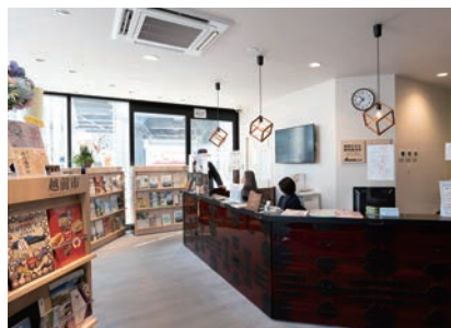
観光案内所では福井県内の観光パンフレットが充実し、丹南エリアの観光情報を提供。高速バスの予約もできる。