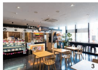
1.2階の「寿司割烹丸松」「海鮮レストラン越前丸松」。新幹線を見ながら食事ができる。 2.弁当店「一乃松」では「焼鯖寿司」が一番人気。3.どら焼きが楽しめる「和すい一つあうん」。 4.大正14年創業「武生製麺」の直売店。越前おろしそばが絶品。