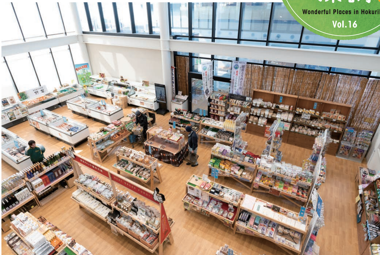
石川、富山、岐阜から多くのお客が訪れる「道の駅 越前たけふ」。物産販売所には鮮魚をはじめ、菓子やお酒、工芸品など越前市を中心に県内の特産品がずらり。